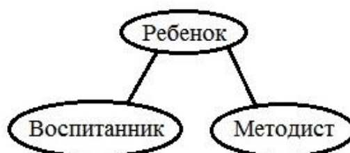
Рисунок 3 – Корреляционная плеяда №2

Как видно из первой плеяды, у педагогов ДООУ категория «Я» тесно связана с категориями «Дети» и «Детский сад», что может свидетельствовать о профессиональной деформации педагогов, свойственной практически любому роду деятельности, если человек занимается ей достаточно долгое время – свое «Я» педагоги ассоциируют с место работы и детьми, выступающими объектом их труда. Отрицательная корреляционная зависимость между категориями «Воспитатель» и «Дети» может свидетельствовать об усталости воспитателей, отсутствии энергии для выполнения своих профессиональных обязанностей. Косвенно это подтверждается тем, что в данном детском саду в штате отсутствуют подменные воспитатели, поэтому большинство педагогов вынуждены работать в две смены по причине плановых отпусков и нахождения на больничном коллег по группе. Кроме того, анализ корреляционной плеяды №2 (а именно, значимая положительная корреляционная связь между категориями «Воспитанник» - «Ребенок» - «Методист») показывает, что воспитатели стремятся переложить функции по организации учебного процесса (т.е «воспитанию» воспитанника) на методиста, максимально вытесняя эту функцию в сферу его ответственности.