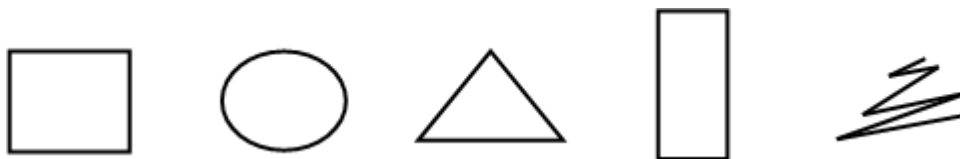
Рисунок 1 – Стимульный материал

Стимульный материал психогеометрического теста состоит из пяти геометрических фигур: квадрат, прямоугольник, треугольник, зигзаг и круг, как показано на рисунке 1.